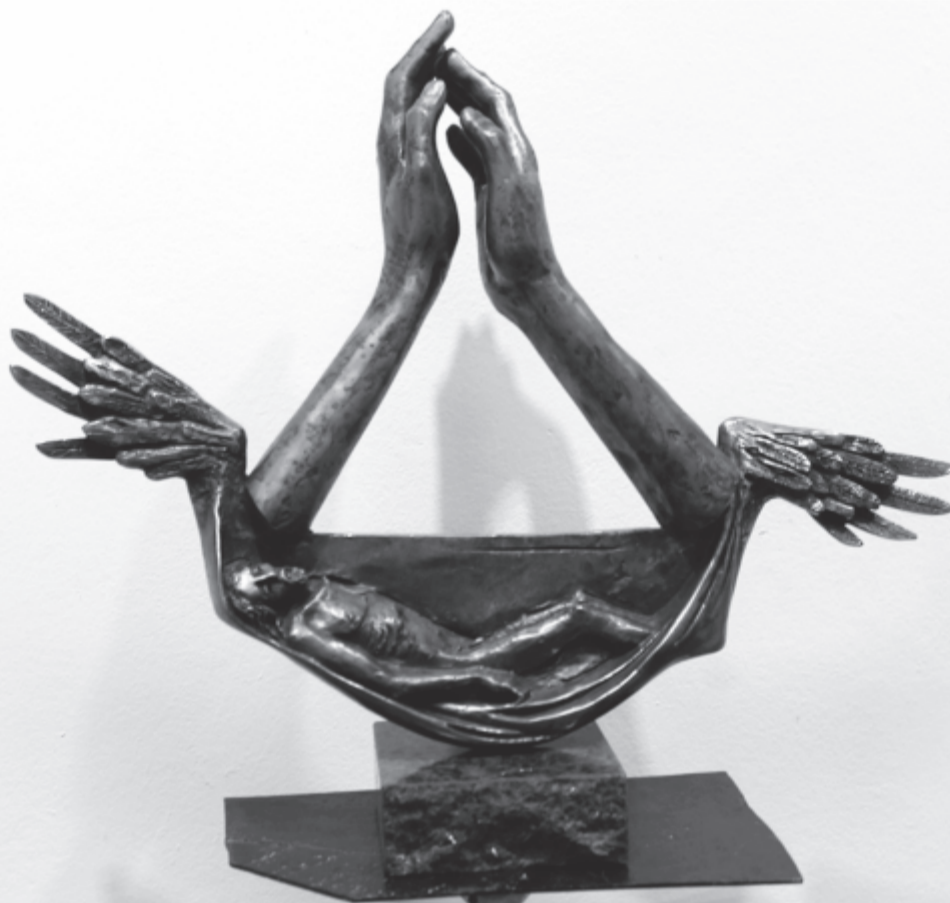
Mellékletünket Gyarmathy János alkotásaival illusztráljuk.

Hűvös és öreg az este. Remeg a venyige teste. Elhull a szüreti ének. Kuckóba bújnak a vénék. Ködben a templom dombja, villog a torony gombja, gyors záporok sötétben szaladnak át a réten. Elhull a nyári ének, elbújnak már a vénék, hűvös az árny, az este, csörög a cserje teste. Az ember szíve kívásik. Egyik nyár, akár a másik. Mindegy, hogy rég volt vagy nem-rég. Lyukas és fagyos az emlék. A fákon piros láz van. Lányok sírnak a házban. Hol a szádról a festék? Kékre csipik az esték. Mindegy, hogy rég vagy nem-rég, nem marad semmi emlék, az ember szíve vásik, egyik nyár, mint a másik. Megcsörren a cserje kontya. Kolompol az ősz kolompja. A dér a kökényt megeste. Hűvös és öreg az este.